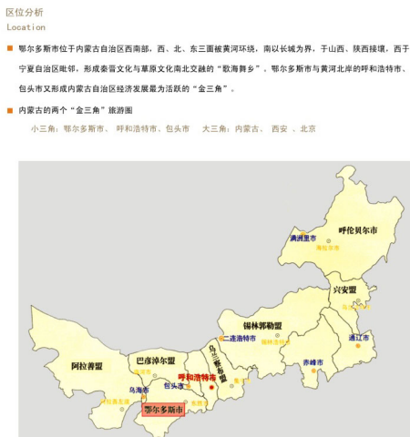
区位分析 Location ■ 鄂爾多斯市位於內蒙古自治區西南部，西、北、東三面被黃河環繞，南以長城為界，與山西、陝西接壤，西與寧夏自治區相鄰，形成秦晉文化與草原文化南北交織的“牧海舞鄉”。鄂爾多斯市與黃河北岸的呼和浩特市、包頭市又形成內蒙古自治區經濟發展最為活躍的“金三角”。 ■ 內蒙古的兩個“金三角”旅遊圈 小三角：鄂爾多斯市、呼和浩特市、包頭市 大三角：內蒙古、西安、北京

大元帝國城的打造，僅就內容來說，也是規畫院引以為傲的。左圖為內蒙古自治區鄂爾多斯大元帝國城戰遊區概念性規畫方案略圖。