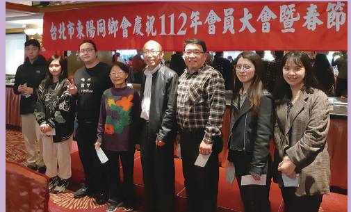
受獎學生與理事長合影

行政院新聞局出版事業登記證局版台誌字第〇三九一號 中華郵政北台字第〇六〇二二號 執照登記為雜誌類交寄