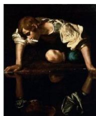
米開朗基羅的納西瑟斯油畫 1597~1599