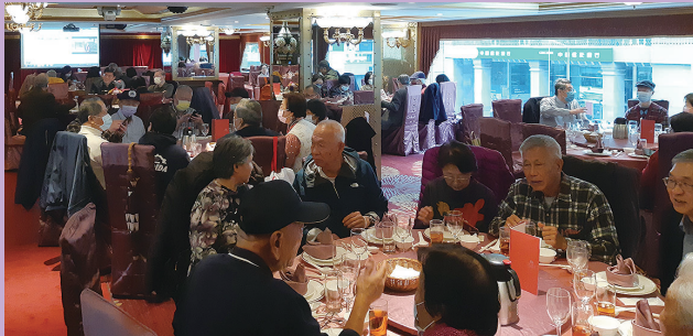
會員大會後聚餐場景